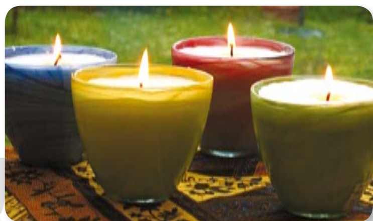
L903 Bougie Grand Stéarôme «Parfum du Midi» Huiles essentielles bio de cèdre, bergamotte, fenouil et lavande. Verre Alabaster veiné d'ocre rouge.

Grands stéarômes pour des combustions de longue durée et pour les soirées en terrasse ou au jardin. La composition des quatre parfums est spécialement étudiée pour le printemps et l'été : Nuit d'été, Fraicheur du jardin, Parfum du midi, et Ciao Mosquito. Volume des verres : 10 cm x 9 cm. Durée de combustion : 35 heures. Nouveau packaging «BLUE Perfumed» bientôt disponible.