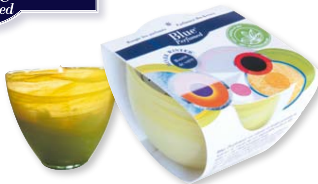
L913 Bougie Stéarôme «Fruits d'hiver» Huiles essentielles bio de clémentine, citron et pamplemousse. Verre Alabaster veiné de jaune.