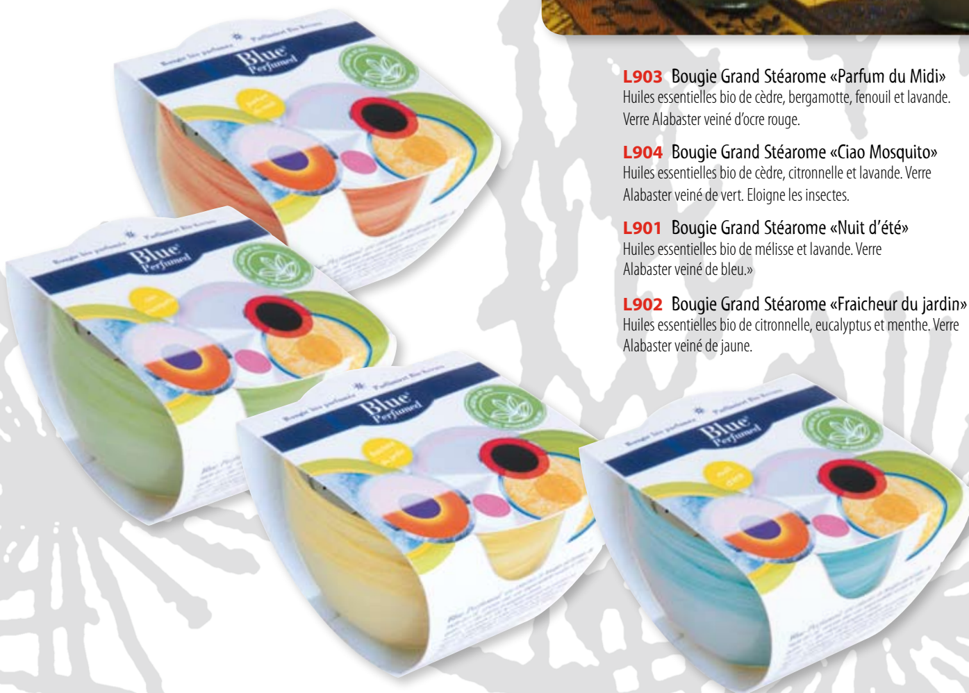
L902 Bougie Grand Stéarôme «Fraicheur du jardin» Huiles essentielles bio de citronnelle, eucalyptus et menthe. Verre Alabaster veiné de jaune.