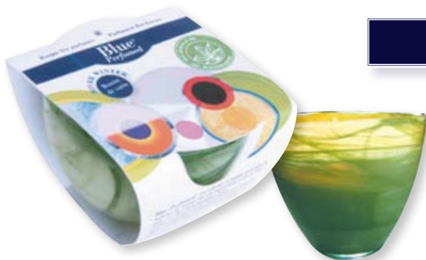
L912 Bougie Stéarôme «Baume de Sapin» Huiles essentielles bio de sapin baumier, gingembre et cardamome. Verre Alabaster veiné de vert.